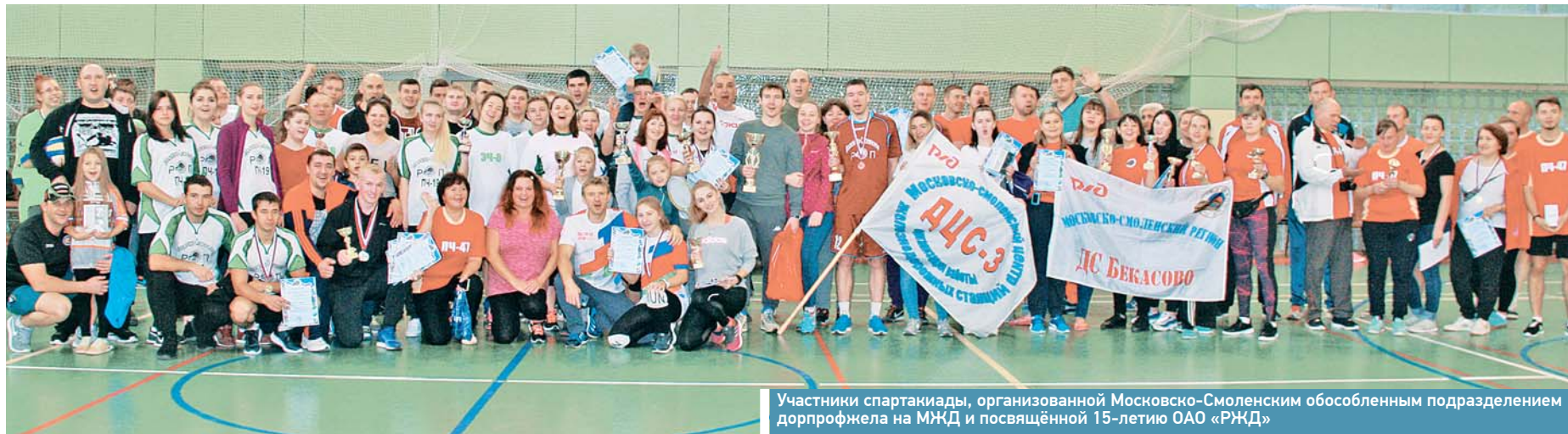
Участники спартакиады, организованной Московско-Смоленским обособленным подразделением дорпрофжела на МЖД и посвящённой 15-летию ОАО «РЖД»

Состоялась спартакиада, посвящённая 15-летию ОАО «РЖД»