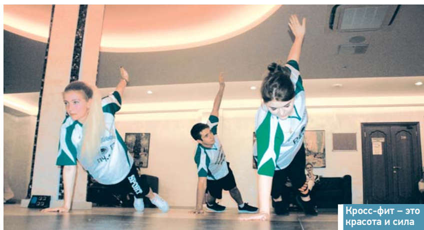
Кросс-фит – это красота и сила

На базе пансионата «Берёзовая роща» с 16 по 18 ноября прошла осенняя спартакиада Московско-Смоленского региона МЖД. Она была организована и проведена Московско-Смоленским региональным обособленным подразделением дорпрофжела на Московской железной дороге и посвящена 15-летию ОАО «РЖД».