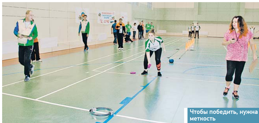
Чтобы победить, нужна меткость