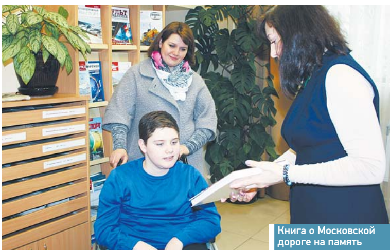
Книга о Московской дороге на память