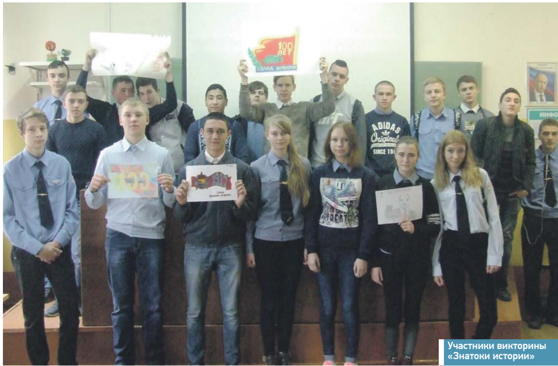
Участники викторины «Знатоки истории»

А для первокурсников была проведена викторина «Памяти павших будем достойны». Познавательный материал о битве за Москву, свои эмоциональные впечатления команды отразили в рисунках, песнях, стихах.