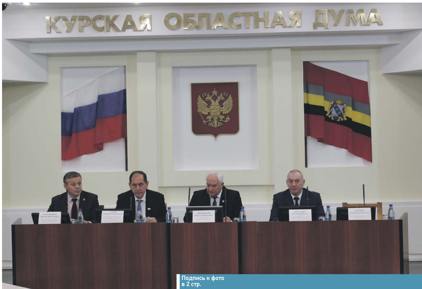
Подпись к фото в 2 стр.

День Московской железной дороги в Курской областной думе