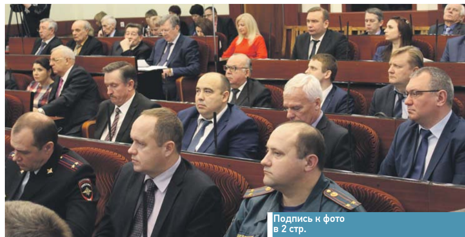
Подпись к фото в 2 стр.

занные с развитием железнодорожной инфраструктуры, наращивания объёмов грузов, переориентированных с автомобильного на железнодорожный транспорт, безопасности движения на железнодорожных переездах, удовлетворения